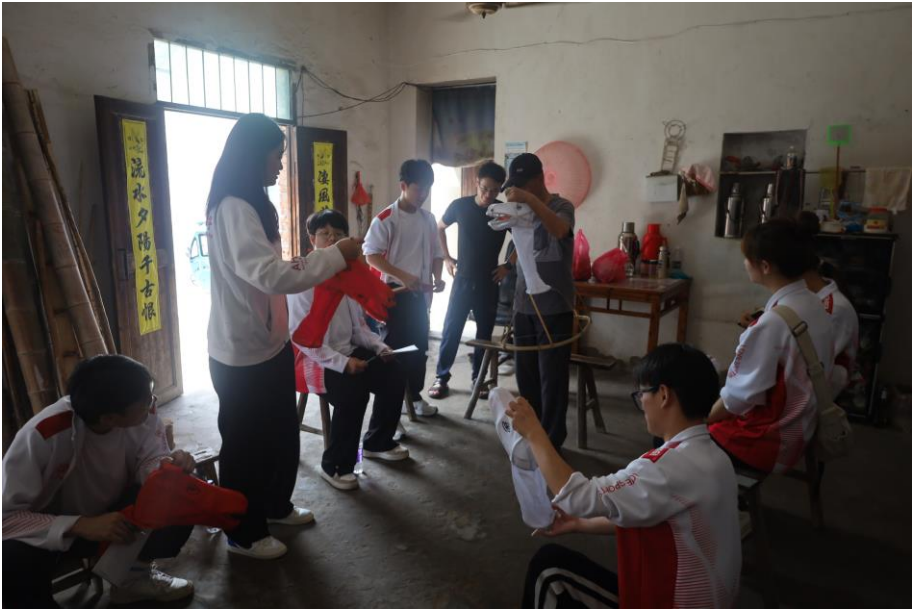
图 2 项目组成员学习马灯制作 (摄于 2024 年 4 月 23 日南陵县许镇上谷村)