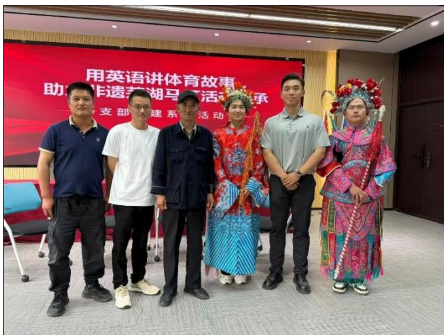
图 4 项目组成员与马灯非遗传承人交流 (摄于 2025 年 4 月 23 日体育学院、外国语学院联合举办交流会)