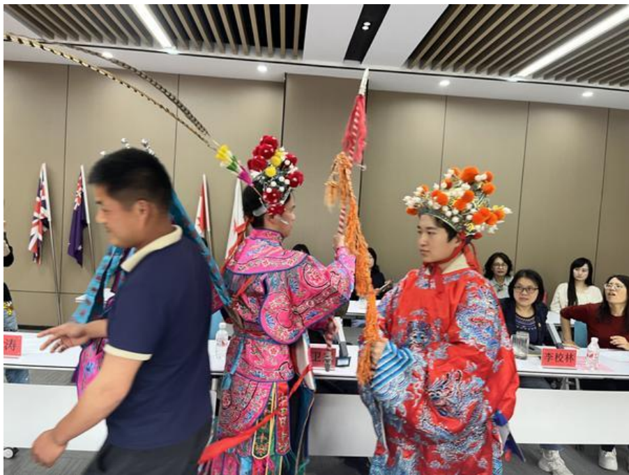
图 3 项目组成员学习马灯套路 (摄于 2025 年 4 月 23 日体育学院、外国语学院联合举办交流会)