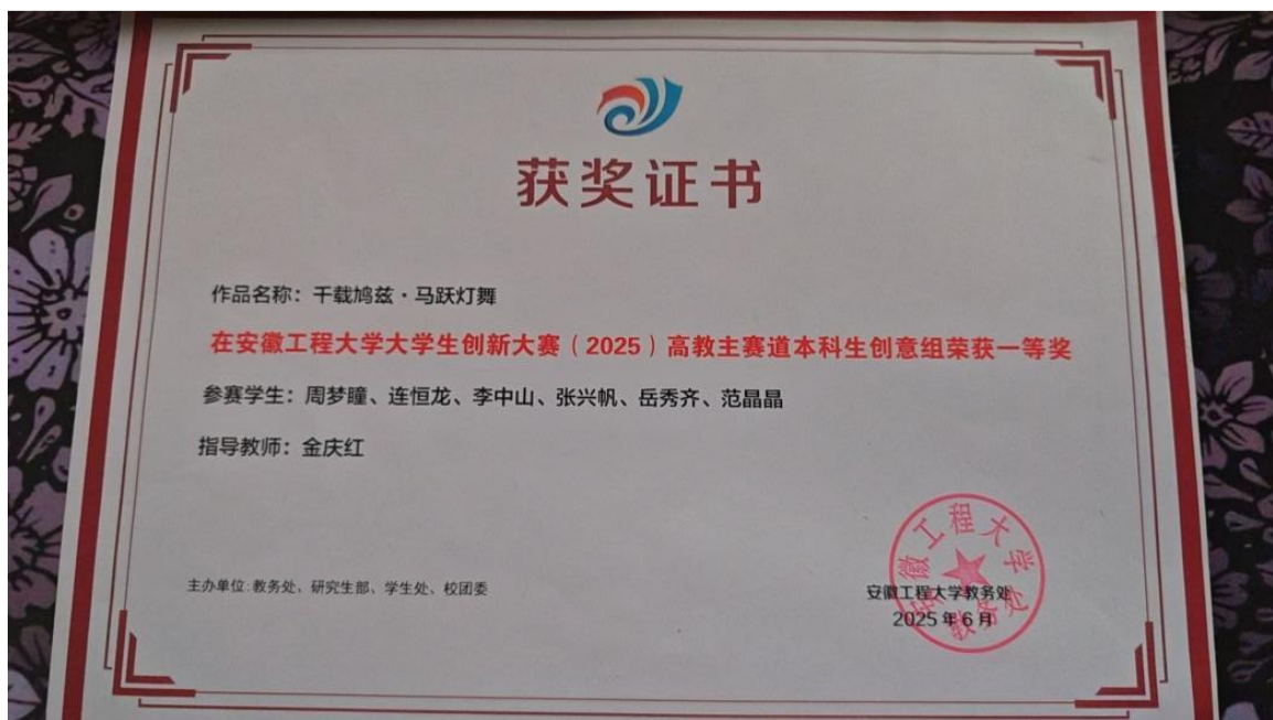
图 5 项目组在创新大赛上获得一等奖