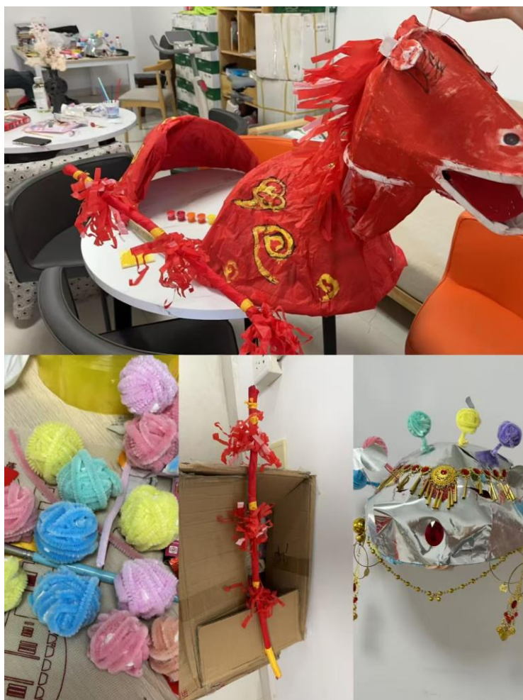
图 7 项目组自制马灯装备