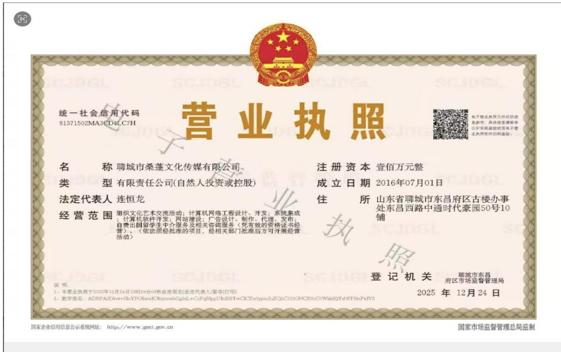
图 6 项目组负责人连恒龙担任公司法人